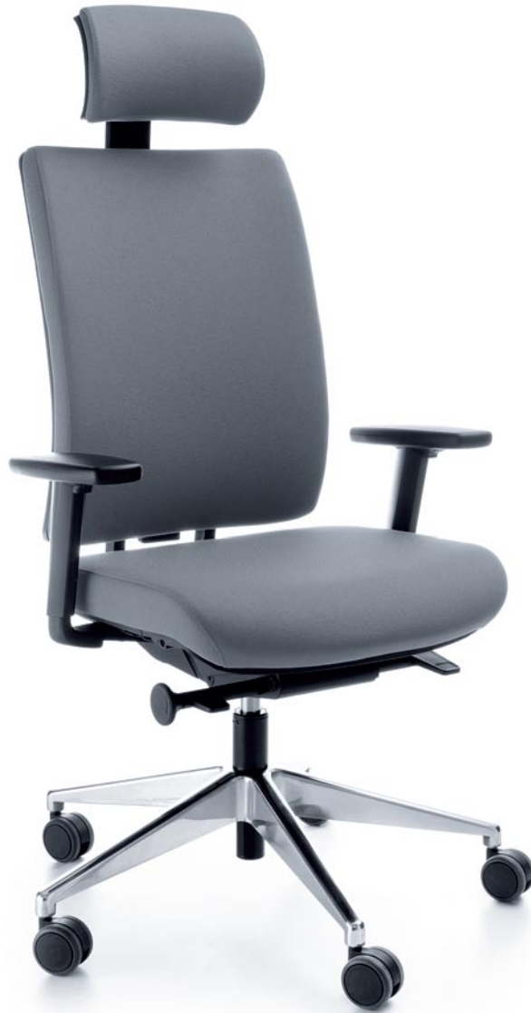
VERIS 111SFL CHROME P54PU