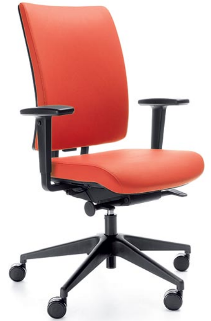
VERIS 10SFL BLACK P48PU