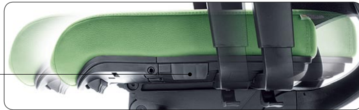
Sliding seat adjustment. Sitztiefenverstellung mit integrierter Taste.