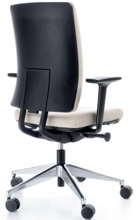
VERIS 10SFL CHROME P51PU