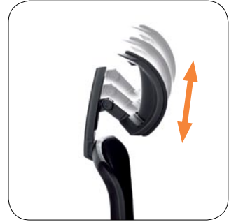
Headrest adjustment. Verstellbare Nackenstütze.