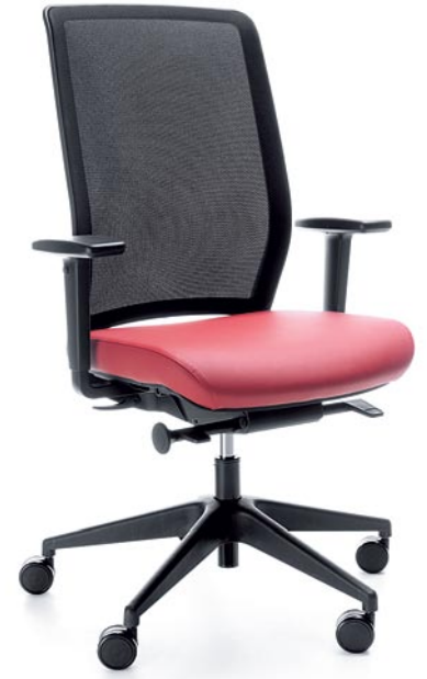
VERIS NET 100SFL BLACK P48PU