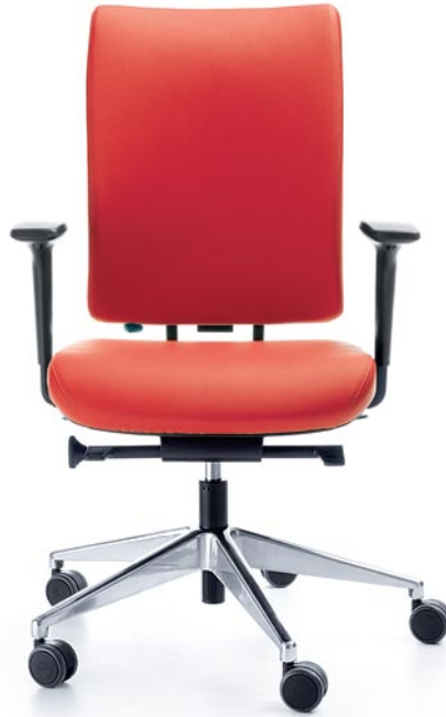
VERIS 101SFL CHROME P48PU