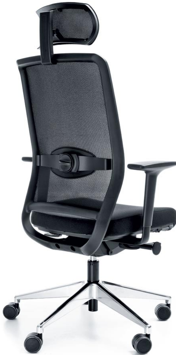
VERIS NET 111SFL CHROME P51PU