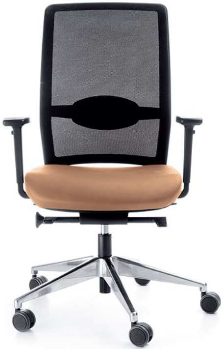
VERIS NET 101SFL CHROME P48PU