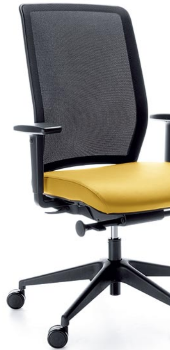
VERIS NET 100SFL BLACK P48PU