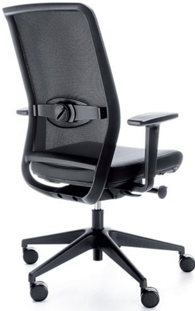
VERIS NET 101SFL BLACK P48PU