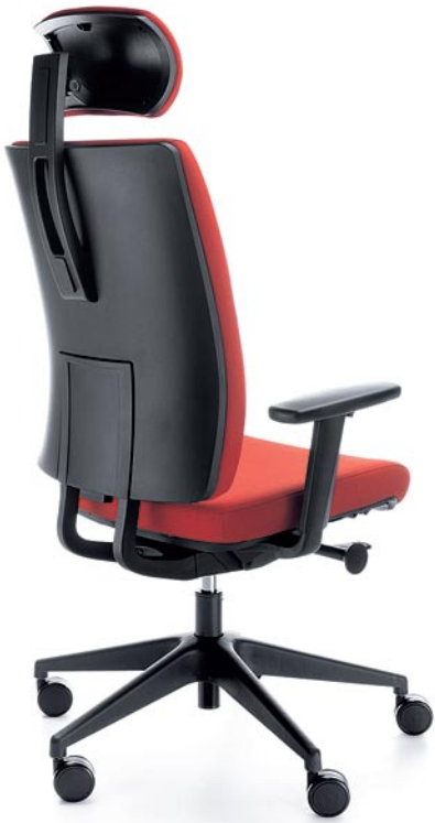
VERIS 11SFL BLACK P54PU