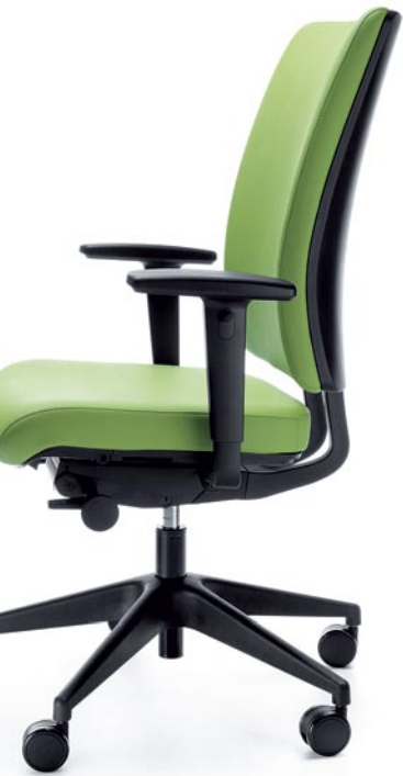
VERIS 10SFL BLACK P48PU