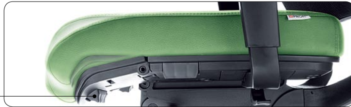
Additional tilt of the front side of seat. Aktive Sitzvorderkante.